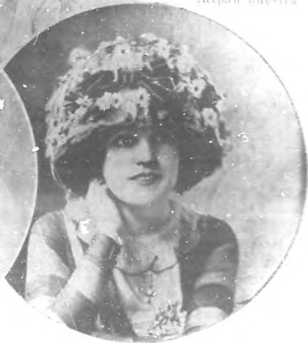
SOMBREROS DE LA CASA DALNAYS DE PARÍS

favorecedores han sido víctimas de un engaño involuntario BOHEMIA lo ha sido de una estafa.